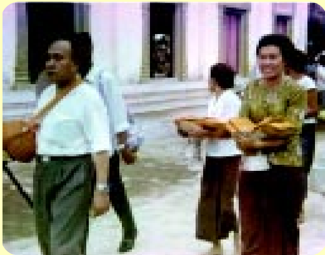
คุณพ่อคุณแม่เจ้าอุปสมบทบุตรคนที่สาม 22 มีนาคม พ.ศ.2513