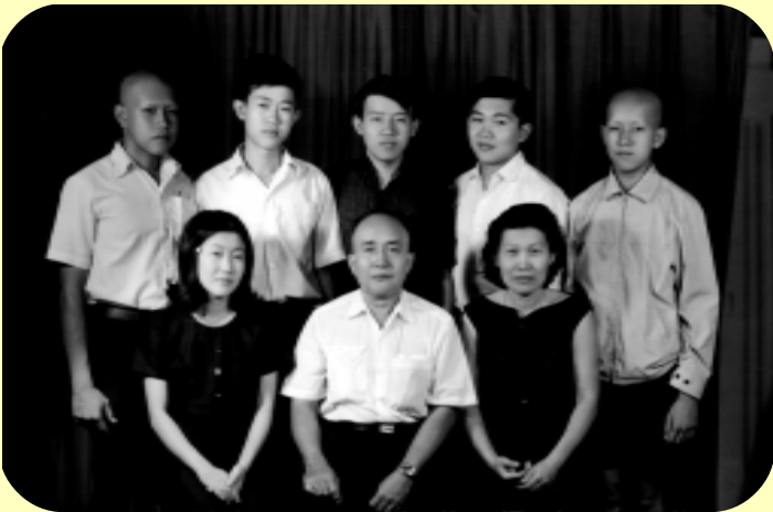
ภาพหมู่ครอบครัวหลังงานศพคุณย่าเมื่อ 8 มกราคม พ.ศ.2515