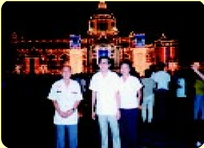
ดูประดับไฟที่ตึกรัฐสภา ธันวาคม พ.ศ.2531