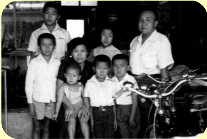
ภาพหมู่ครอบครัว 23 มีนาคม พ.ศ. 2503