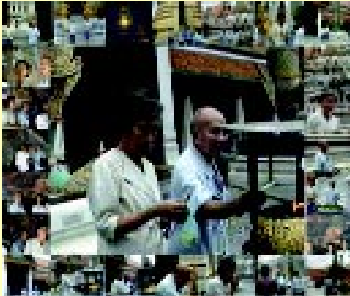
ที่วัดพระศรีรัตนศาสดาราม (วัดพระแก้ว) 9 มิถุนายน พ.ศ.2533