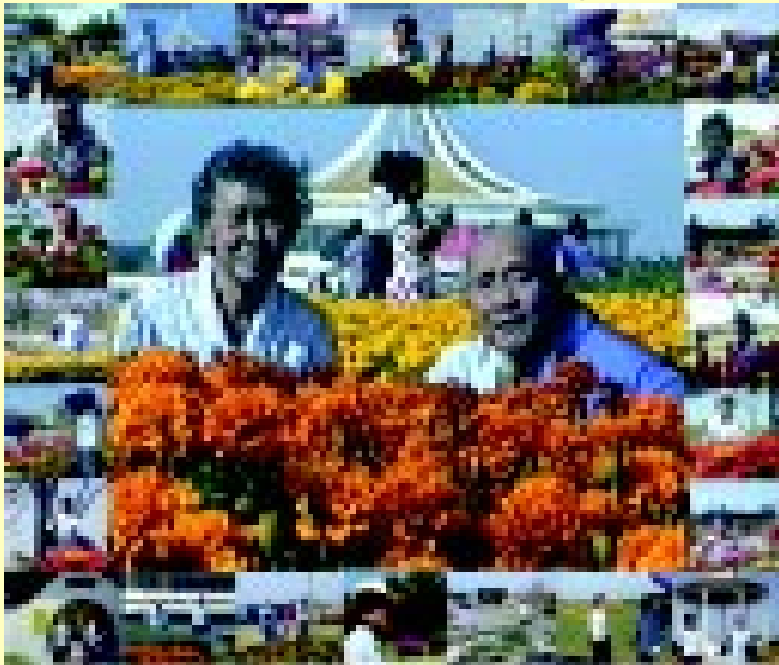
สวนหลวง ร.๙ เมื่อ 8 ธันวาคม พ.ศ.2533