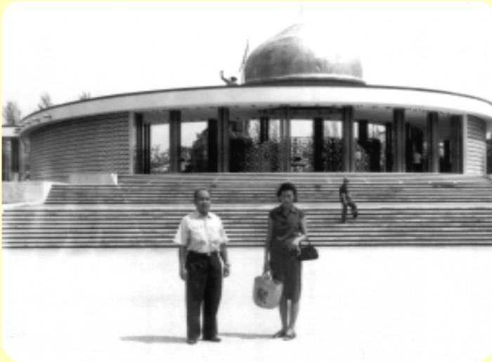
ที่อนุสาวรีย์สันติภาพในกัวลาลัมเปอร์ มาเลเซีย 23 เมษายน 2514