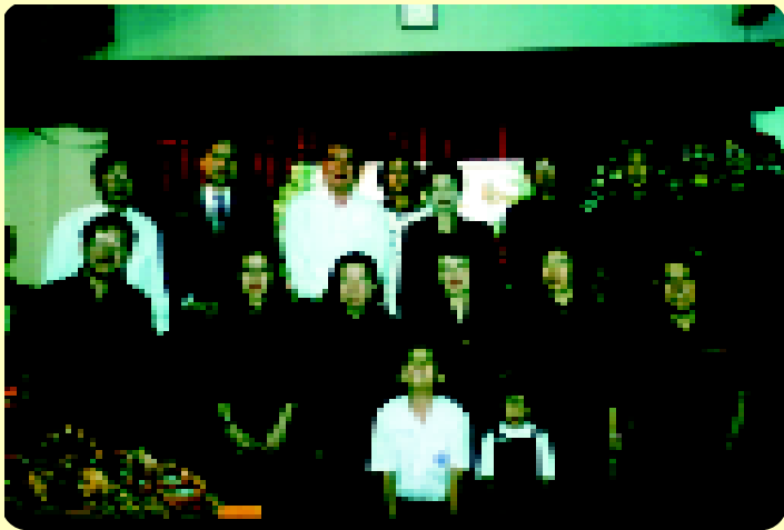
ลูกๆ หลานๆ และญาติพี่น้องในงานสวดอภิธรรม