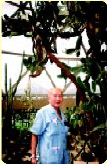
ในจีโอเทลิคโดม สวนหลวง ร.9 25 มกราคม พ.ศ.2541