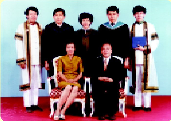
ในโอกาสบุตรชายคนเล็กได้รับปริญญาแพทยศาสตร 17 กรกฎาคม 2525