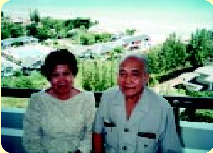
โรงแรมฮิกมา รีสอร์ท พัทยา 10 สิงหาคม พ.ศ.2530