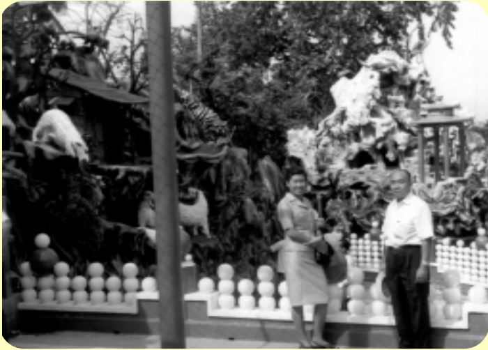
ในสวนจำลองไถ่บูนไฮ้ ลิงคโปร์ 25 เมษายน 2514