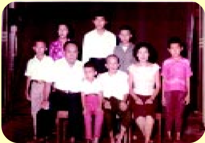
ภาพหมู่ครอบครัวพร้อมคุณย่า 15 พฤษภาคม พ.ศ.2506