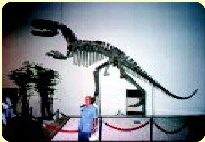
โครงกระดูกไทแรนโนซอร์ส สวนสยาม 12 เมษายน พ.ศ.2537