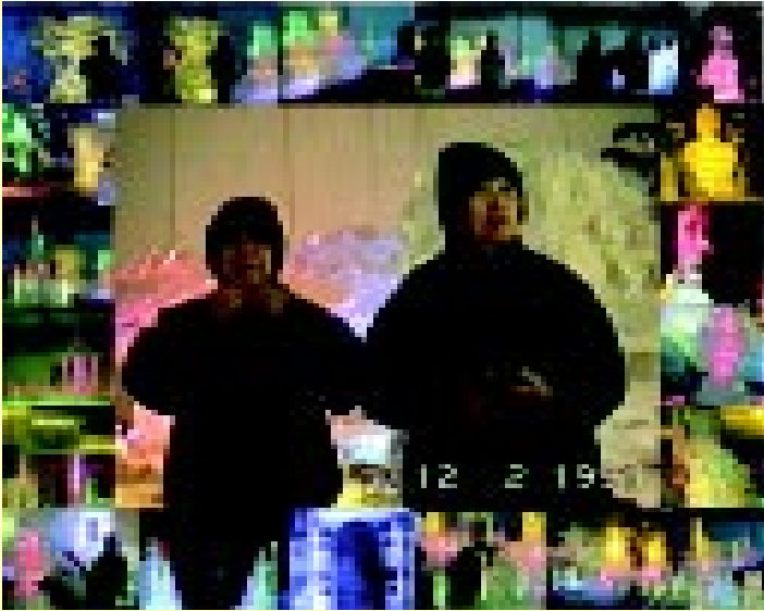
ประติมากรรมปราสาทน้ำแข็ง ณ แดนเนรมิตร 12 กุมภาพันธ์ พ.ศ.2534