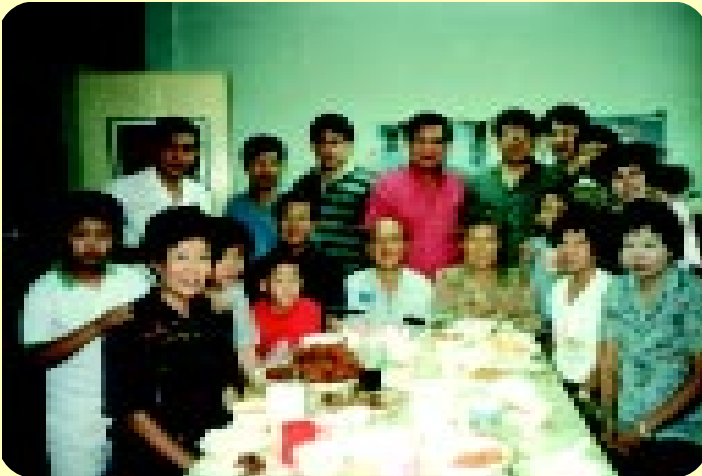
ที่ติ๊กสพานเหลืองเมื่อ 2 มิถุนายน พ.ศ.2534