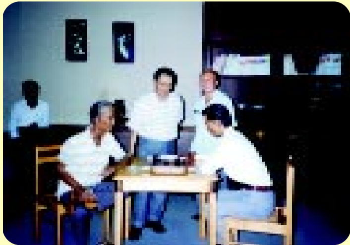
พิพิธภัณฑน์หุ่นซีผึ้ง 6 มีนาคม 2537