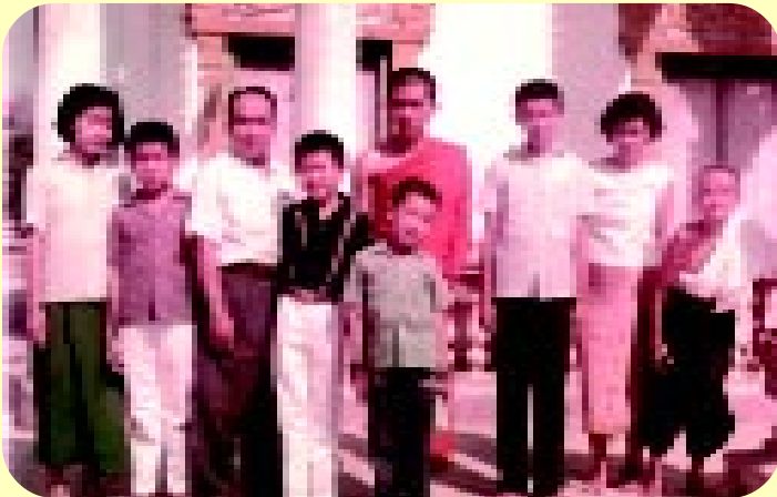
ภาพหมู่ครอบครัวเมื่ออุปสมบทบุตรคนแรก 26 มีนาคม พ.ศ.2508