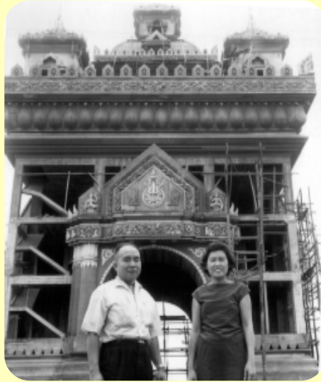
นครเวียงจันทร์ 15 กรกฎาคม 2510