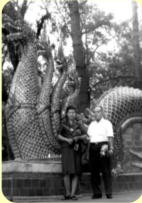
คุณพ่อคุณแม่ที่วัดพระธาตุดอยสุเทพราชวรวิหาร พ.ศ.2506