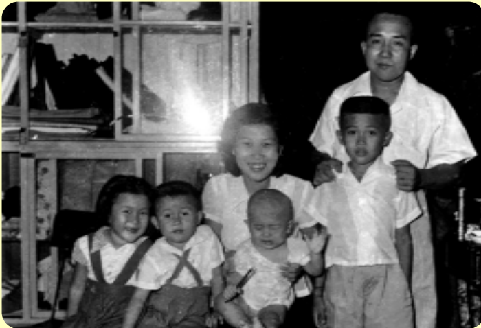
ภาพหมู่ครอบครัวเมื่อ 4 สิงหาคม พ.ศ. 2495