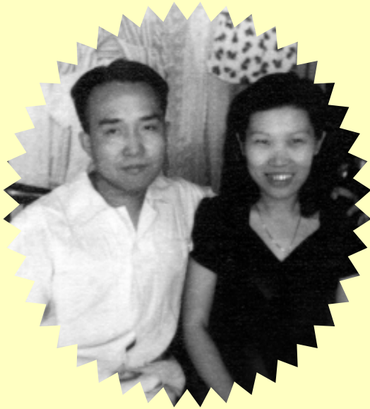
คุณพ่อคุณแม่ที่ร้านวารณี บางมุลนาก เมื่อ พ.ศ. 2491