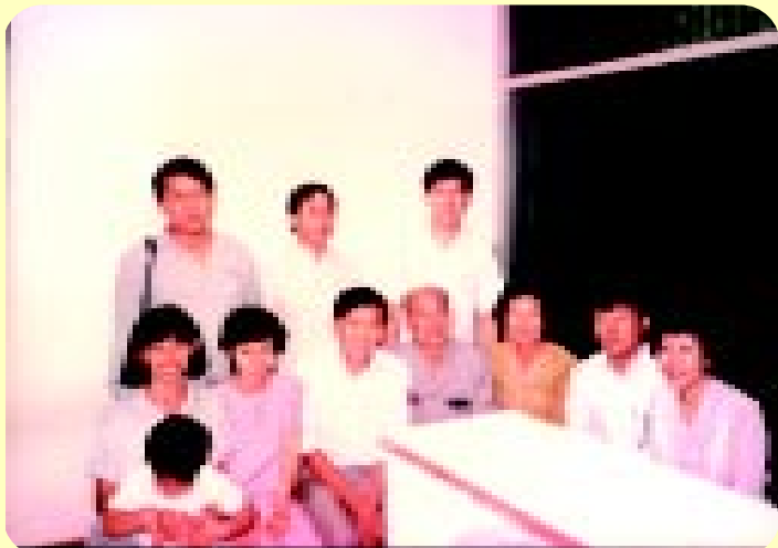
ที่คลินิกแพทย์ พ.ศ.2528