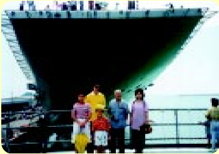
เรือหลวงจักรีนฤเบศน์ 25 ตุลาคม 2540