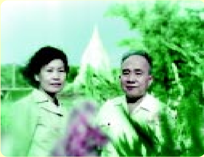
เมืองโบราณ บางปู ก.ม.34 13 กรกฎาคม 2517