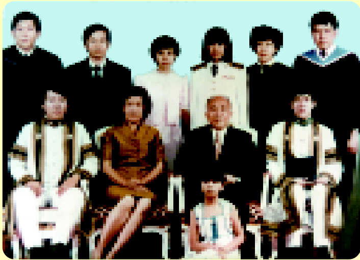
พร้อมครอบครัวของลูกลูกและหลาน 17 กรกฎาคม 2525